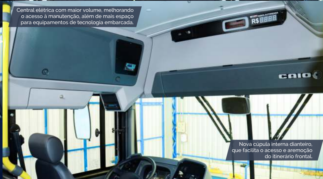
Central elétrica com maior volume, melhorando o acesso à manutenção, além de mais espaço para equipamentos de tecnologia embarcada.