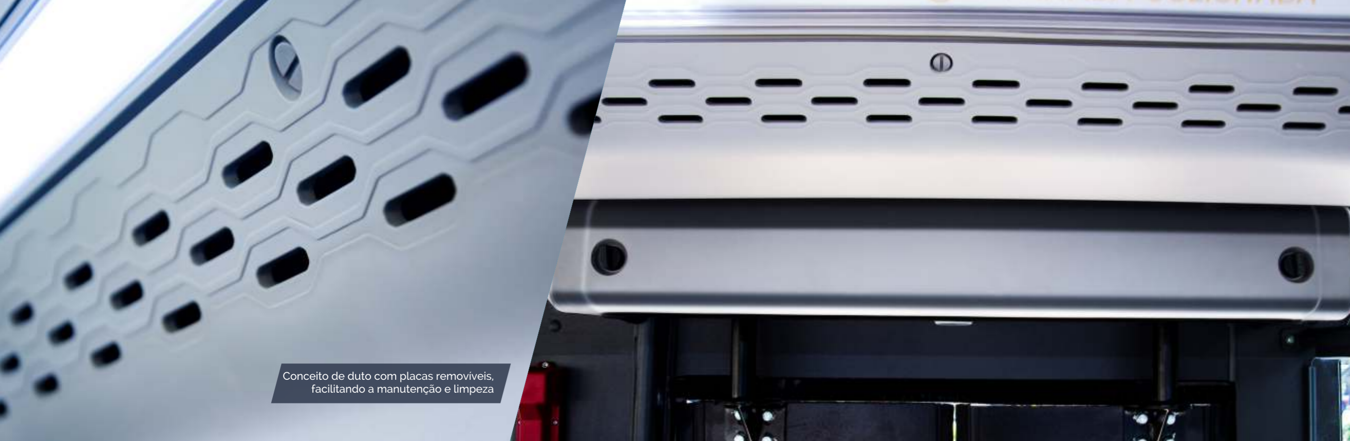
Conceito de duto com placas removíveis, facilitando a manutenção e limpeza